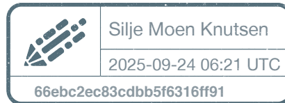
Silje Moen Knutsen

Følgende skal signere at protokollen er lest: